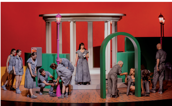
Ensemble Schauspiel Essen

Die letzte Premiere im Grillo-Theater zeigt eine ungewöhnliche Form von Theater. Schon die sprachliche Ebene ist bemerkenswert: Die szenische Erstaufführung im deutschsprachigen Raum der 1948 erschienenen Kurzgeschichte „The Lottery“ der US-amerikanischen Autorin Shirley Jackson kommt ohne